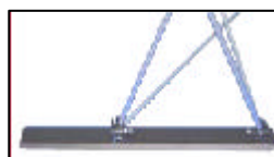
Peu suport estructura recta