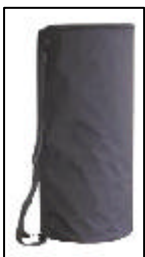
Bossa transport nylon (1,5 Kg) buida