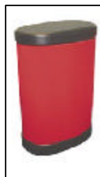
Maleta mostrador (9Kg) buida