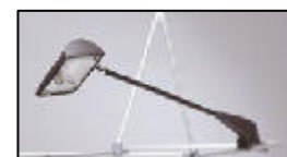
Foco spotlight 200w